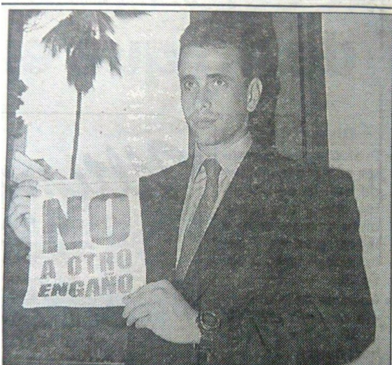
Caracas, viernes 26 de noviembre de 1999