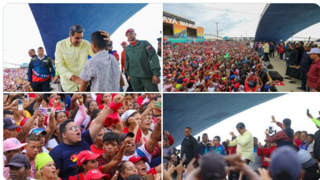
10:23 p. m. · 31 may. 2024 ·

El pueblo: sus hombres, mujeres, juventud, abuelos y las abuelas son mis maestros y maestras, los escucho siempre, aprendo de ustedes para brindar soluciones, innovando, creando y en acción concreta. Ha valido la pena ser leal al pueblo, a Chávez y a la Patria.