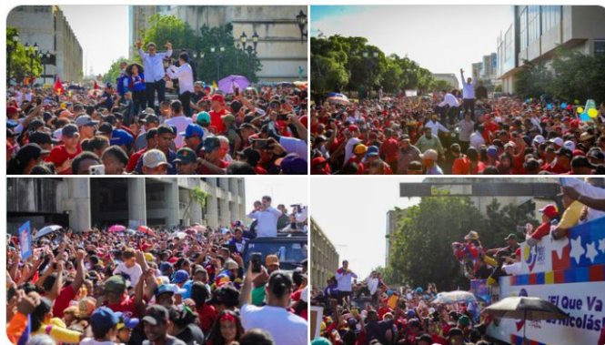
9:22 p. m. · 1 jun. 2024 ·

Miren qué hermoso es el pueblo aguerrido y alegre de Maracaibo que se desbordó, es maravilloso ver y recibir tanta emoción y pasión de nuestras mujeres, hombres, jóvenes, niños y niñas. ¡Muy bonita sorpresa! ¡La esperanza está en la calle! ¡Viva el Zulia!