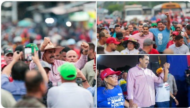
10:40 a. m. · 6 jun. 2024 ·

Le recuerdo que el domingo #9Jun , tenemos una cita muy importante, estaré muy pendiente del 1X10, revisándolo calle por calle, comunidad por comunidad y UBCH por UBCH, porque tenemos que construir la victoria perfecta del #28Jul , con la unión del pueblo. Veo en los ojos de las mujeres y los hombres de a pie la fuerza de la verdad y la victoria.